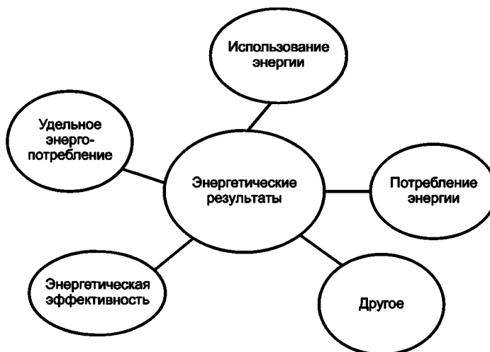
Рисунок А.1 — Концептуальное представление энергетических результатов

Концептуальное представление энергетических результатов приведено на рисунке А.1.